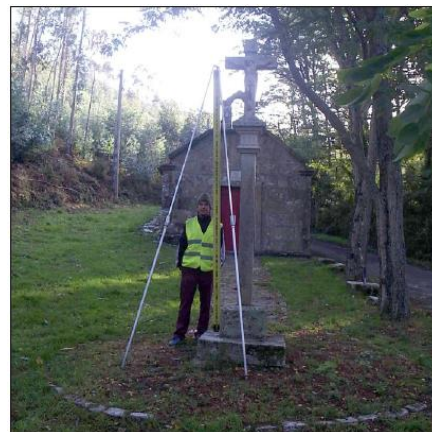
Nivelación de Mareógrafo en Ferrol