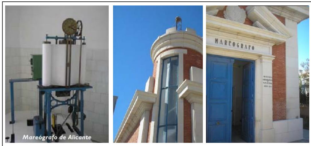
Antiguo Mareógrafo de Alicante (IGN)

El Instituto Geográfico Nacional (IGN) establece el origen de altitudes en tierra o cero geodésico . En la Península Ibérica se utiliza el Nivel Medio del Mar en Alicante (NMMA) obtenido a partir de datos de nivel del mar en este puerto, durante la década 1870-1880 (por esta razón, el mareógrafo de Alicante fue el primer mareógrafo español instalado con carácter permanente, y por tanto la serie de datos de nivel del mar más larga de nuestro país). En las islas se utiliza como cero el nivel medio del mar local . Éste se obtiene a partir de las mediciones de nivel del mar de un mareógrafo permanente en dicha isla, si existe, para un periodo determinado. De esta forma, las altitudes en la isla de Tenerife, por ejemplo, estarán referidas al Nivel Medio del Mar en Tenerife, y así sucesivamente.